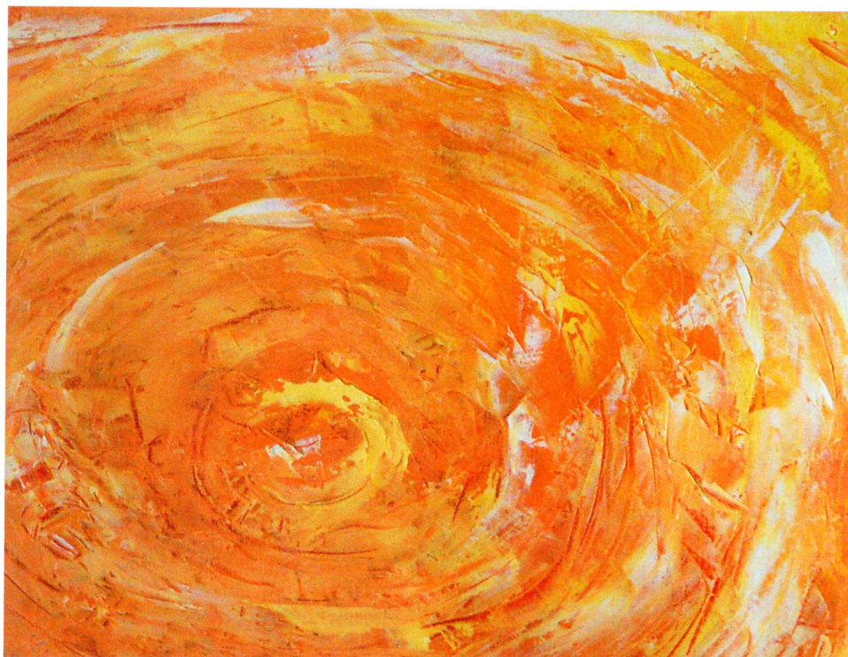
Hledání středu v nekonečném Avalonu

V ČR, v Belgii, v Itálii, v Portugalsku a na Novém Zélandu