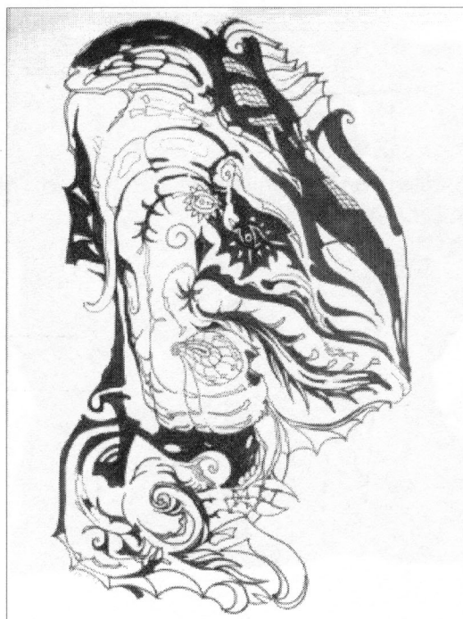
"Le signe du feu" 1995

Peintre et graveur, professeur à l'Académie des Beaux-Arts de Bratislava, expositions dans le monde entier.